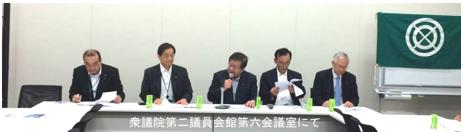
衆議院第二議員会館第六会議室にて

世界連邦日本国会委員会と世界連邦宣言自治体全国協議会による意見交換会が7月9日、衆議院第二議員会館第六会議室で行われた。