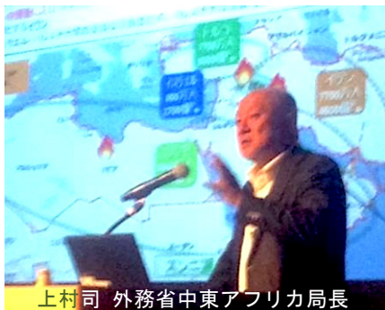
上村 司 外務省中東アフリカ局長

世界連邦宣言自治体全国協議会の総会に引き続き、研修会が一般公開で行われた。小金井在住の上村司・外務省中東アフリカ局長を講師として「中東情勢